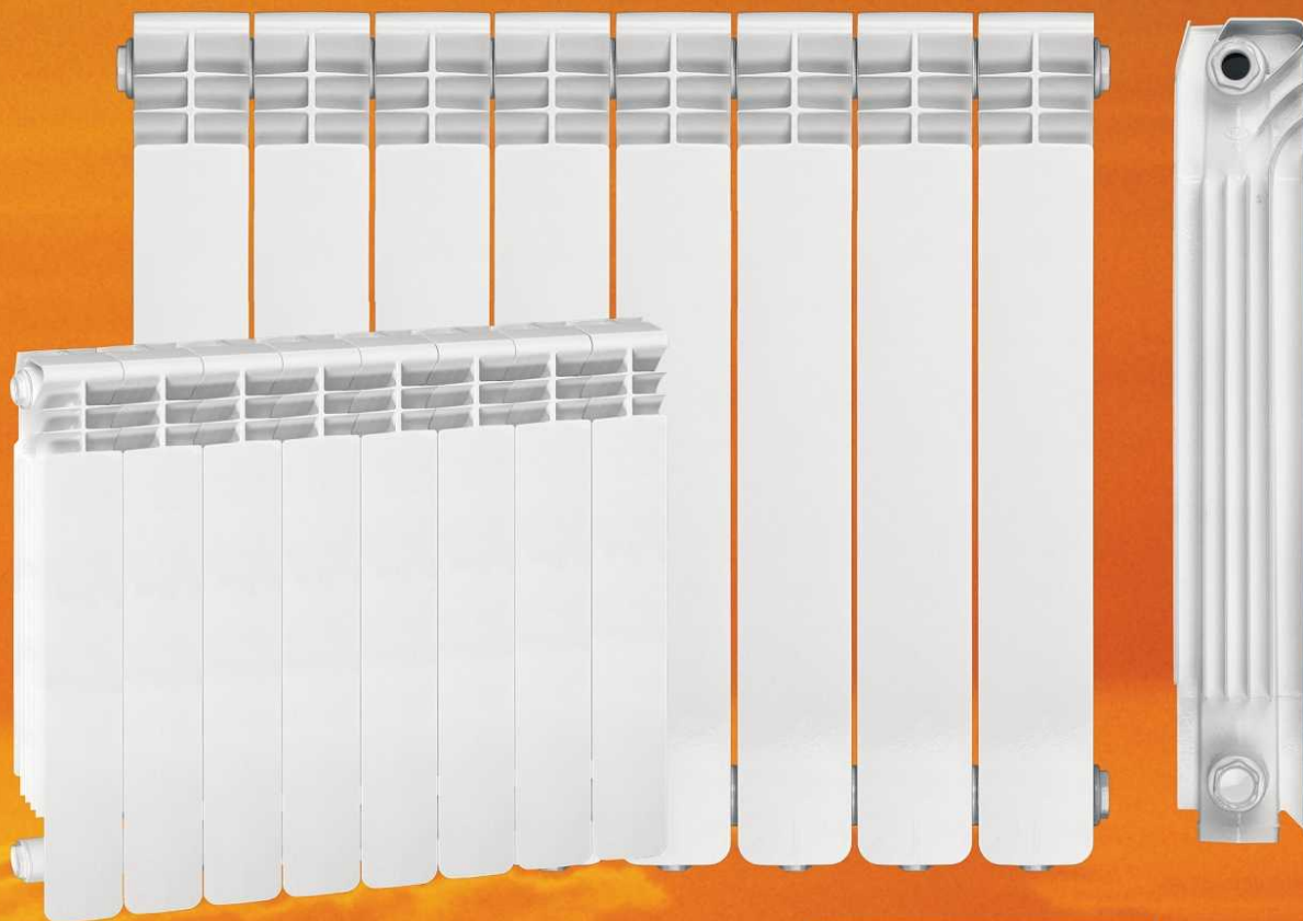
Grzejnik aluminiowy Wulkan h-500 biały GRZ.WULKAN H-500.B.