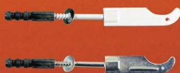
Wieszak grzejnikowy wkręcany ocynk lub biały

WI.Z.KOŁ.OC. WI.Z.KOŁ.7-BI. WI.Z.KOŁ.8-BI.