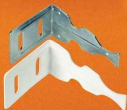
Wieszak grzejnikowy metalowy gięty ocynk lub biały